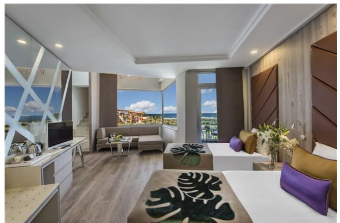
BE Family Loft